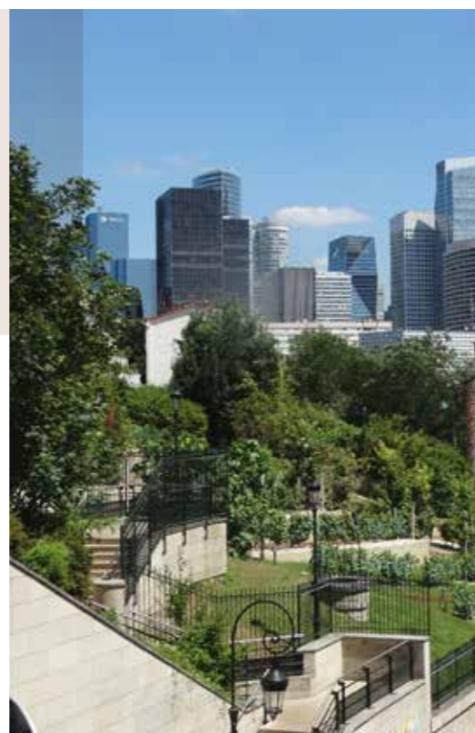
Au pied du quartier d'affaires de La Défense