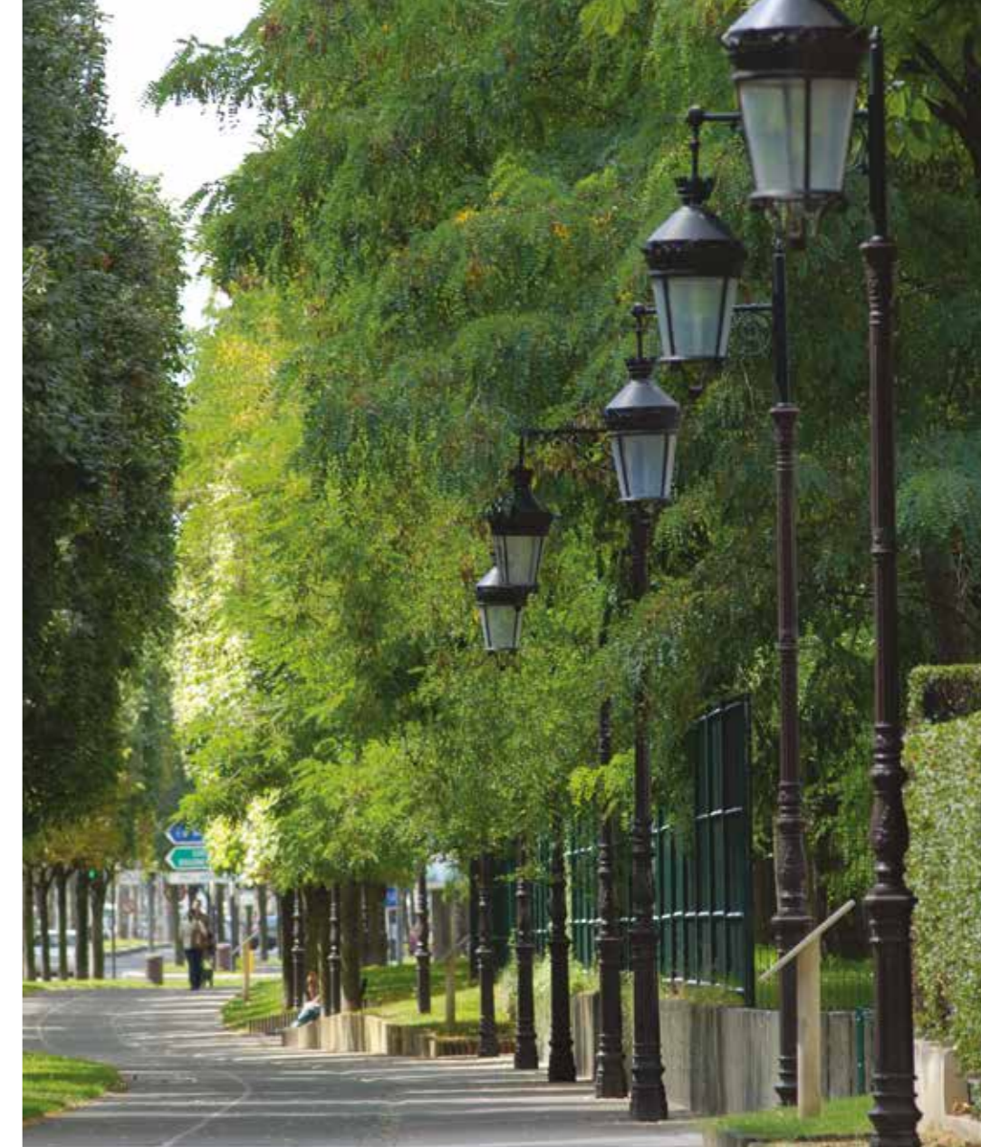
Les bords de Seine

Longée par la Seine, Puteaux témoigne de la douceur de vivre des villes au bord de l'eau. Son île, avec une roseraie, un parcours de santé en sous-bois et un kiosque à musique préserve les Putéoliens de la ville trépidante. La piscine et les festivals annoncent la belle saison. De l'autre côté du pont, le Bois de Boulogne et ses musées offrent d'autres destinations de promenade. De l'artothèque à la Maison de Camille, de la Roseraie au Jardin des Vignes, Puteaux trouve l'équilibre parfait entre nature et culture.