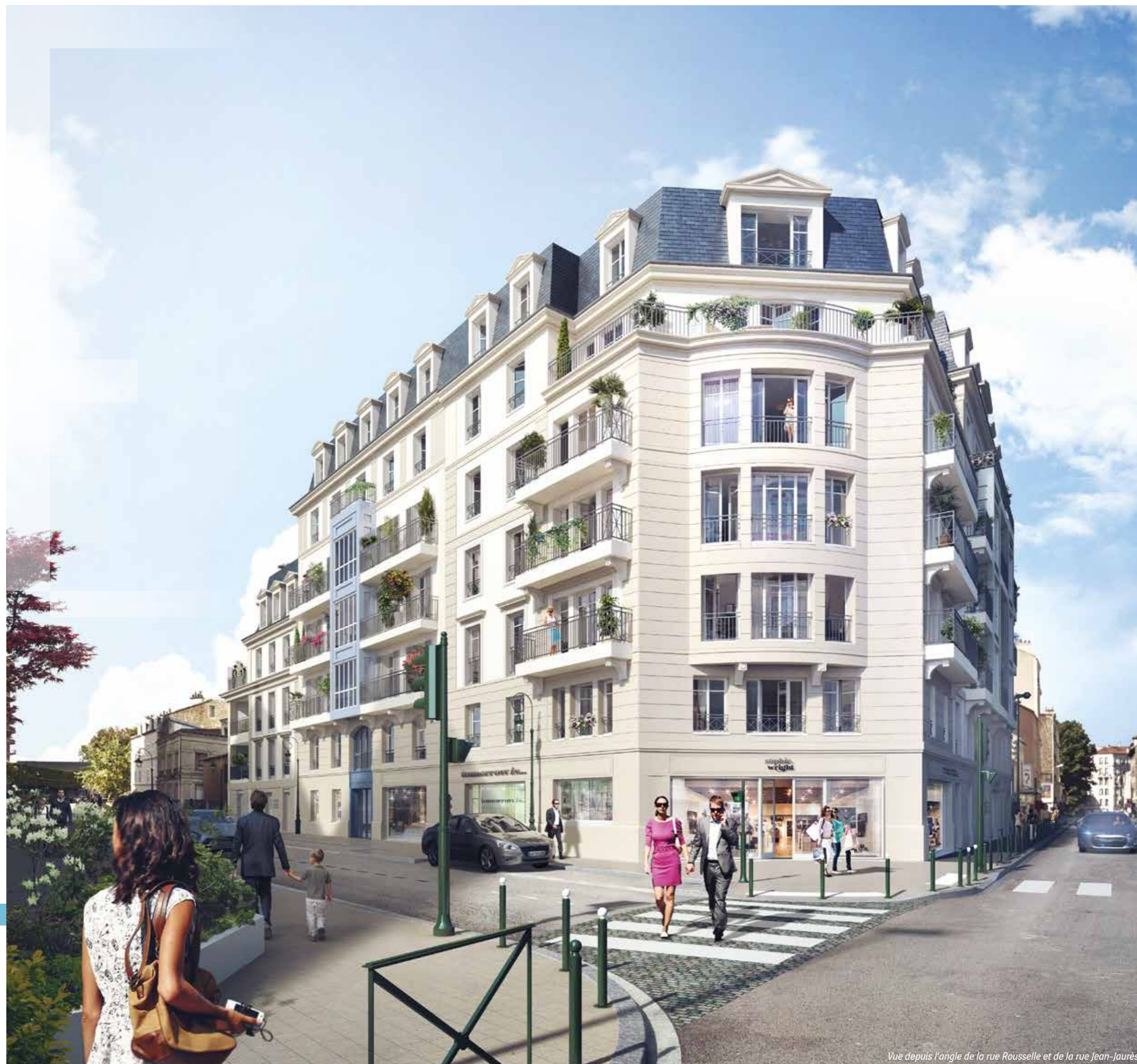
Vue depuis l'angle de la rue Rouselle et de la rue Jean-Jaurès