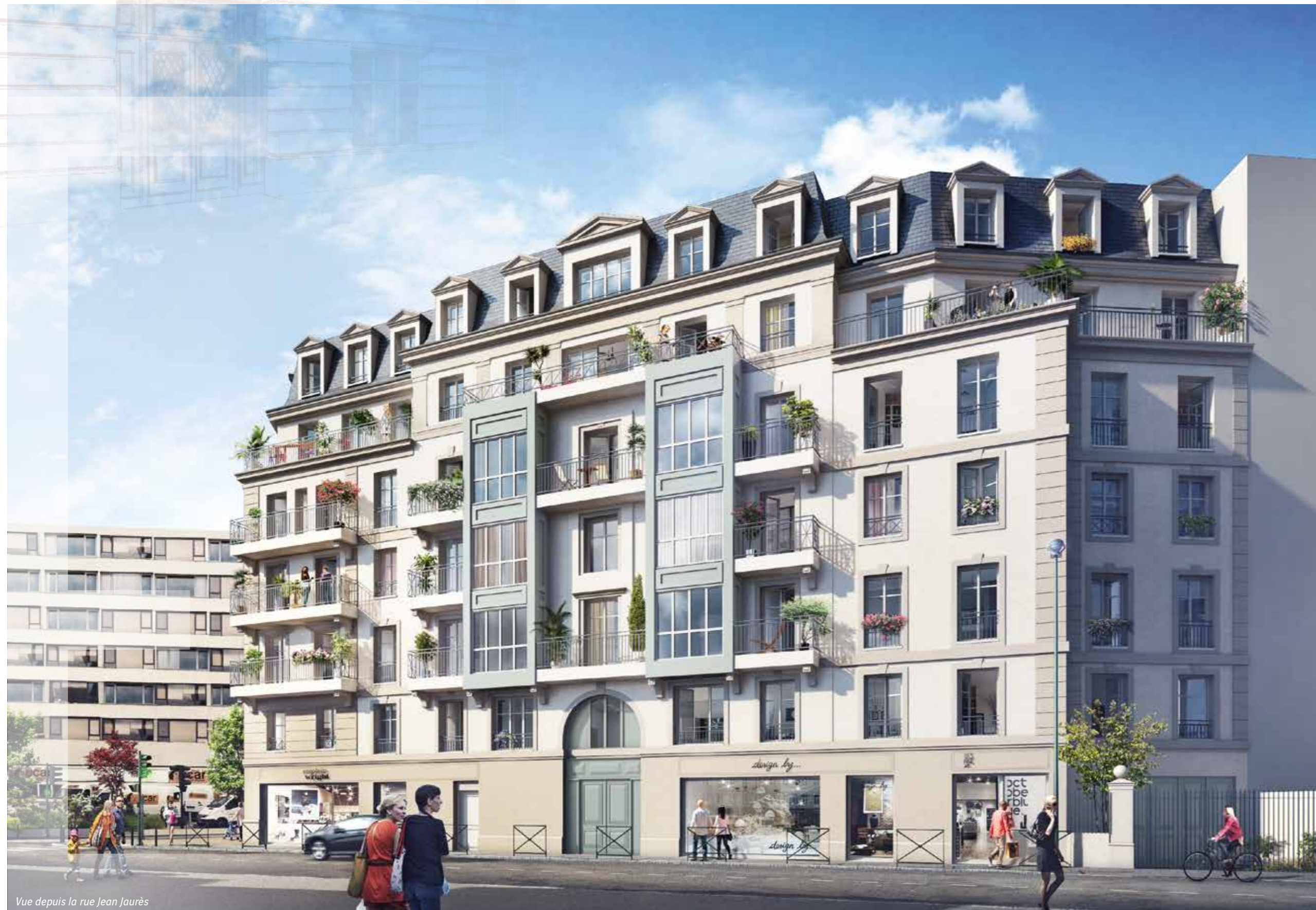
Vue depuis la rue Jean Jaurès

À proximité de l'esplanade de l'Hôtel de ville, Éloquence présente fièrement sa silhouette séquencée. Édifié sur 6 étages, ce bel immeuble d'angle affiche une écriture classique et une façade rythmée de nombreuses baies. Une toiture d'ardoise et zinc ponctuée de lucarnes coiffe cette résidence rassurante. Un large pan coupé à l'angle des deux rues, tel un signal architectural, fait face à la nouvelle place. Des bow-windows à dominante métallique ponctuent les façades et leur confèrent couleur et modernité. Les balcons et les retraits aux derniers étages animent l'ensemble, tout en harmonie.