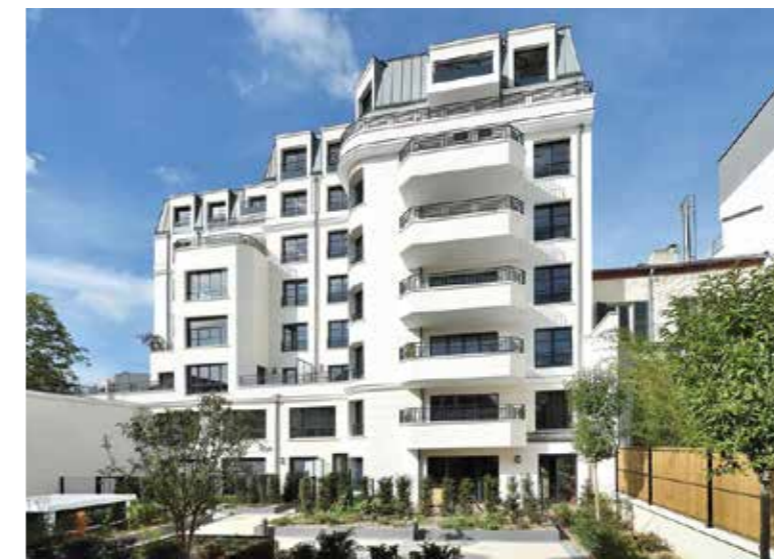
16 Victor Hugo