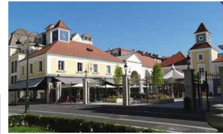
Place du Théâtre

Une architecture soignée, des façades élégantes et des appartements dotés de tous les éléments de design et de confort capables de répondre aux attentes d'aujourd'hui. Une qualité qui s'apprécie d'abord au présent et prend toute sa valeur avec le temps.