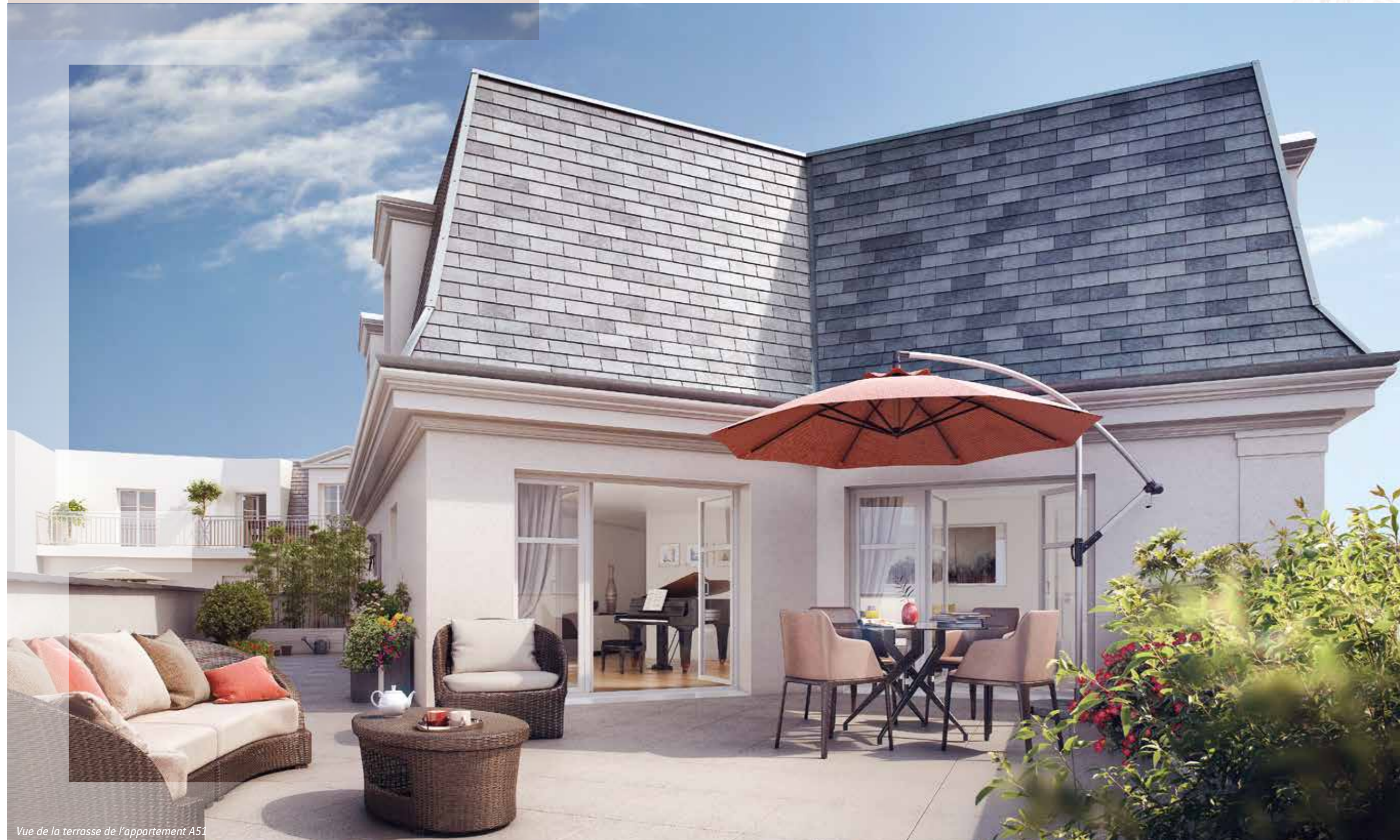
Vue de la terrasse de l'appartement A51

La conception des plans a fait l'objet de toutes les attentions : dispositions bien conçues, volumes généreux pour les espaces de réception, balcons et terrasses pour la plupart des appartements. Du studio au 5 pièces, Éloquence offre le privilège d'une adresse située au cœur de l'animation commerçante tout en ménageant la quiétude des résidents.