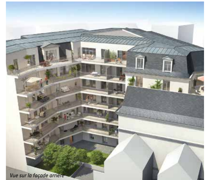
Vue sur la façade arrière