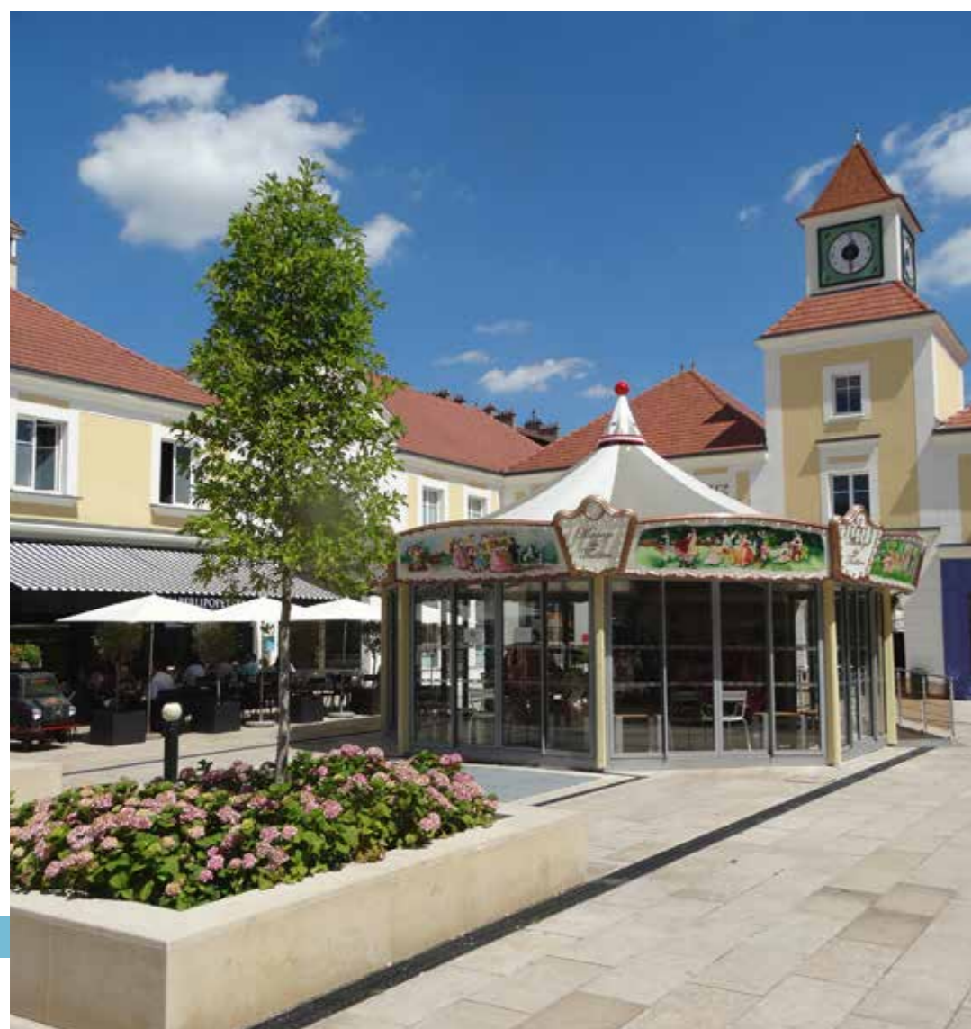
Les commerces de la place du Théâtre

Les fleurons de l'industrie avaient donné le coup d'envoi. La Défense a transformé l'essai et Puteaux s'est hissée parmi les communes les plus prisées de l'Île-de-France. Pourtant, la ville se targue d'avoir su entretenir jalousement son esprit village. En témoignent les lampadaires qui ponctuent les ruelles et les placettes pavées. En célébrant son passé villageois, la ville fascine par sa singularité et par cet art de vivre si tranquille, tout en étant près de La Défense et Paris.